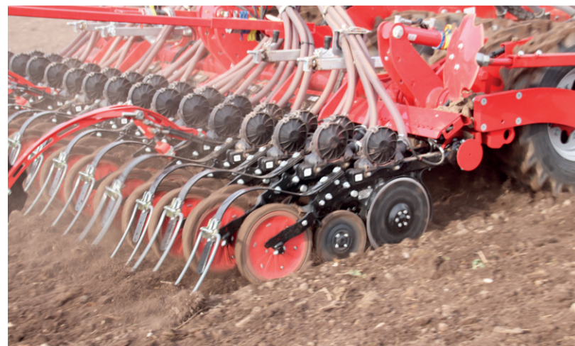
■ Forsøgsparellerne med enkornssået vinterhvede på Frijsenborg er tilsået med en seks meter Horsch Pronto luftassisteret såmaskine udstyret med små udmadningsenheder på såskærene - det såkaldte Horsch Singular System - til enkornssåning af korn.

- På samme måde som eksempelvis i roer og majs skal man ved enkornssåning af korn være meget omhyggelig med såbedstilberedningen for at sikre, at alle kerner spirer frem. Og så skal man selvfølgelig også sørge for at bruge såsæd af høj kvalitet, lyder det fra Arne Gejl.