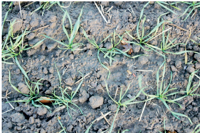
■ Udsnit af forsøgsparelle på Frijsenborg med enkornssået vinterhvede af sorten KWS Extase. Der er sået 75 planter pr. kvadratmeter.