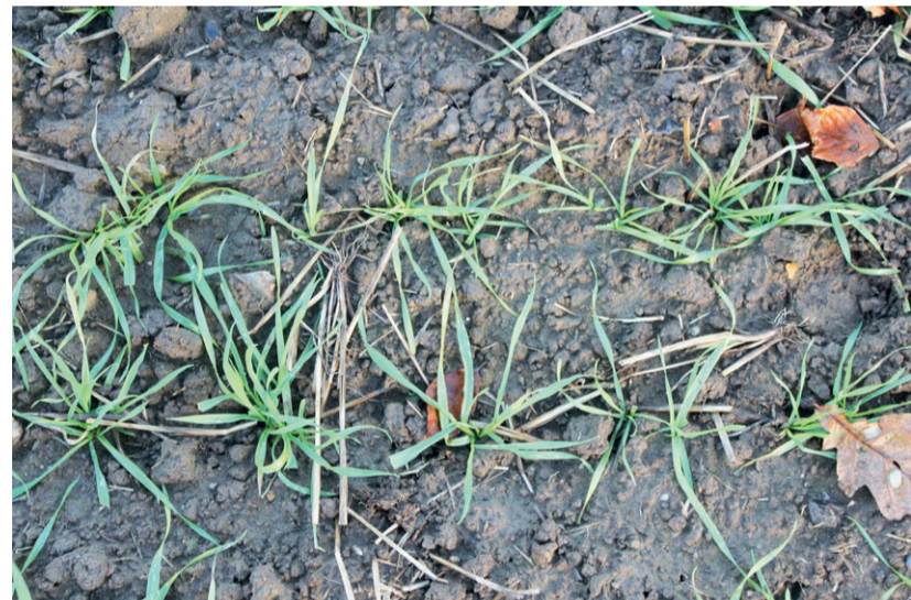
■ I denne enkornssåede forsøgsparelle på Frijsenborg er der 175 vinterhvedeplanter pr. kvadratmeter af sorten KWS Extase.